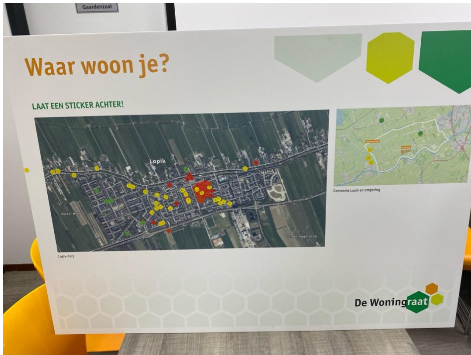
Paneel met stickers en kaart Lopik-dorp en omgeving. Omwonenden zijn rood, geïnteresseerden geel, en overig groen.