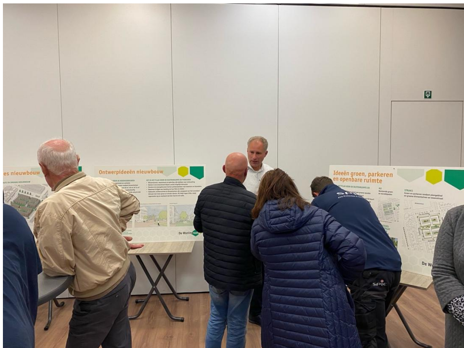
Bewoners in gesprek met een van de architecten